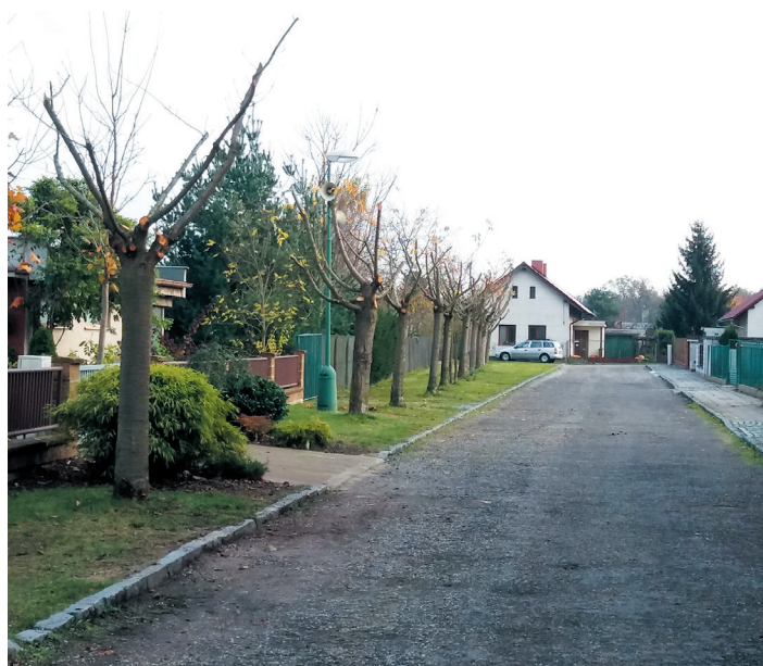
Sakury rostoucí v Nedbalově ulici prošly pravidelnou údržbou korun. (era)

Od ledna 2018 budou uzavírány nové smlouvy na pronájem hrobových míst na čepeském hřbitově. Doba pronájmu bude 5 let. Přesné datum, od kdy se začnou smlouvy uzavírat, bude zveřejněno na úřední desce obecního úřadu, na webových stránkách obce www.ceperka.cz a také místním rozhlasem. (era)