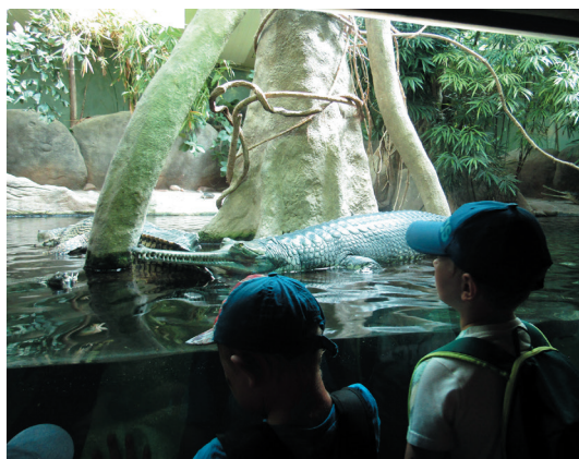
V červnu navštívili nejmenší žáci – prvňáčci pražskou zoo. Výlet si náramně užili.