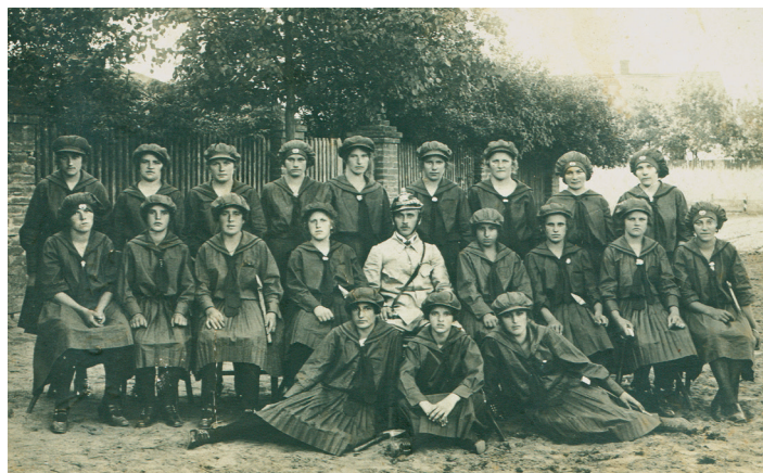
Hasiči a hasičky. Nahoře snímek obecních hasičů z počátku 20. let 20. století. Aktivní v obci byly i ženy. Na snímku dole družina čeperských hasiček. (era)