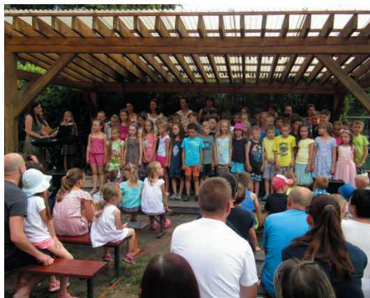
Poslední školní týden jsme společně oslavili konec školního roku 2016-2017 na tradiční letní slavnosti.