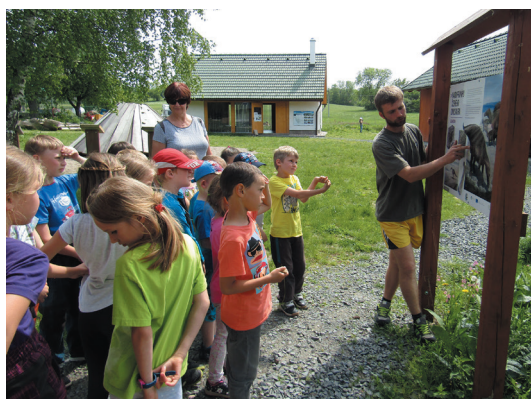
Ze školy v přírodě v ekologickém centru na Pasíčkách.