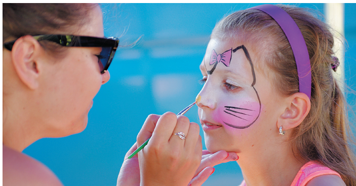
Oslavu 240 let od založení obce si na hřišti užily také děti.