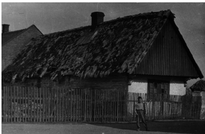
Podoba původních domů ve vsi. Dům č. p. 1 stál naproti křížku. Foto z roku 1960.