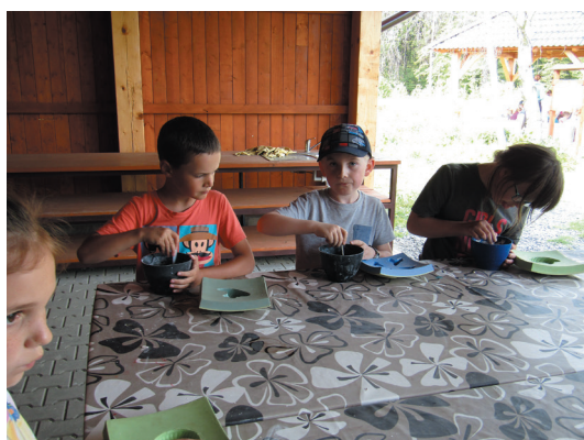
Ze školy v přírodě v ekologickém centru na Pasíčkách.